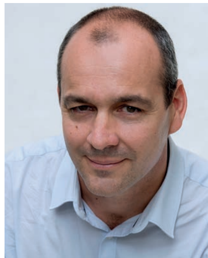
Laurent Berger Secrétaire général de la CFDT

Avec ces dix candidats CFDT, c'est toute notre organisation qui s'engage afin que « petite entreprise » ne rime pas avec « petits droits ». Merci pour la confiance que vous apporterez par votre vote, une confiance dans notre action quotidienne à vos côtés. ”